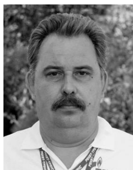
Главный судья (Руководитель гонки)