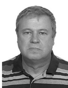
Офицер парка сервиса Тех. контролёр (Ст. судья бригады)