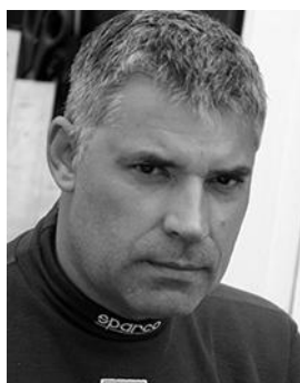
Офицер по связи с участниками